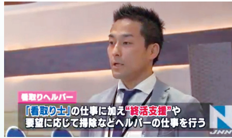
看取りヘルパー 「看取り士」の仕事に加え「終活支援」や要望に応じて掃除などヘルパーの仕事を行う

か。5月末、弊社が取り組んでいる看取り事業がTBS報道番組Nスタで特集され、看取りヘルパーがクローズアップされました。